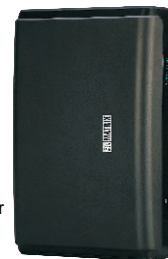
SAPEX Multifunkciós IP-PBX Szerver

MATRIX TELECOM SOLUTIONS www.matrixtelecom.hu